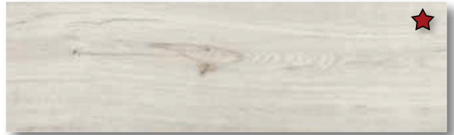
Rovere Crystal [5501]